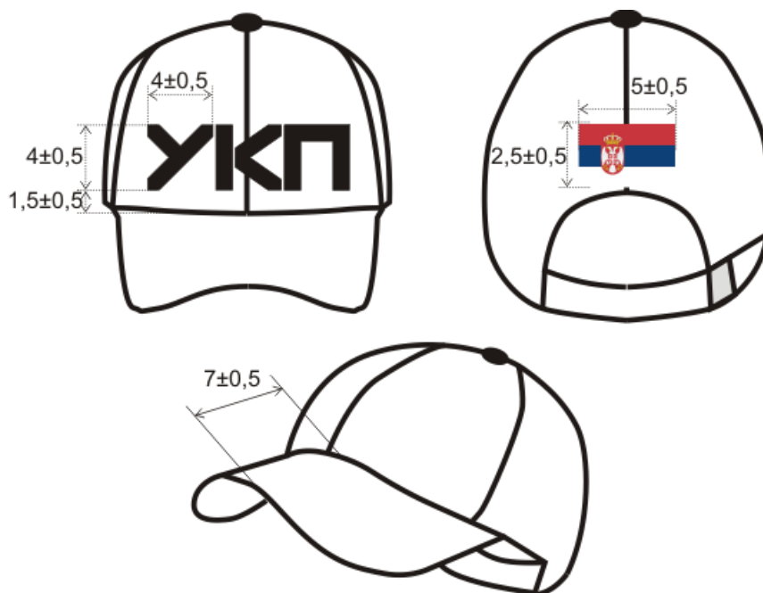
Изглед качкета према скици.