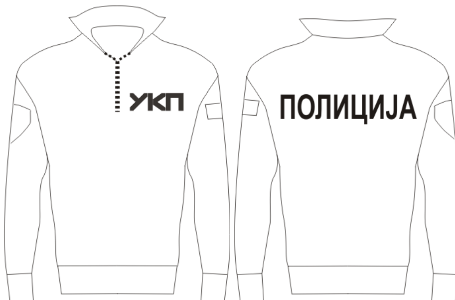
Изглед мајице према скици