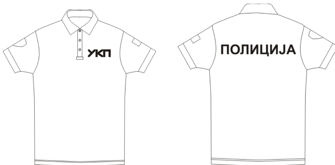
Изглед мајице према скици.