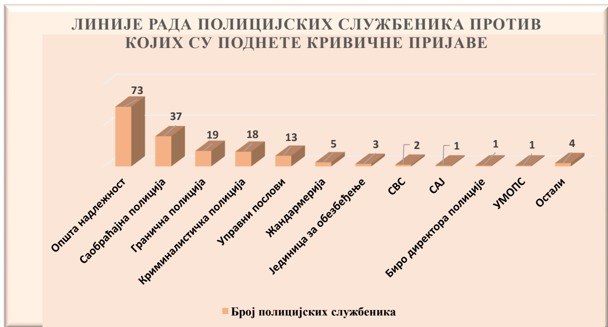
Графикон број 4

Међу полицијским службеницима против којих су поднете кривичне пријаве у току 2022. године, полицијски службеници полиције опште надлежности представљају 41% , док полицијски службеници саобраћајне полиције представљају 20% . Исти је однос учешћа наведених линија рада и када су у питању кривичне пријаве због извршених кривичних дела са елементима корупције.