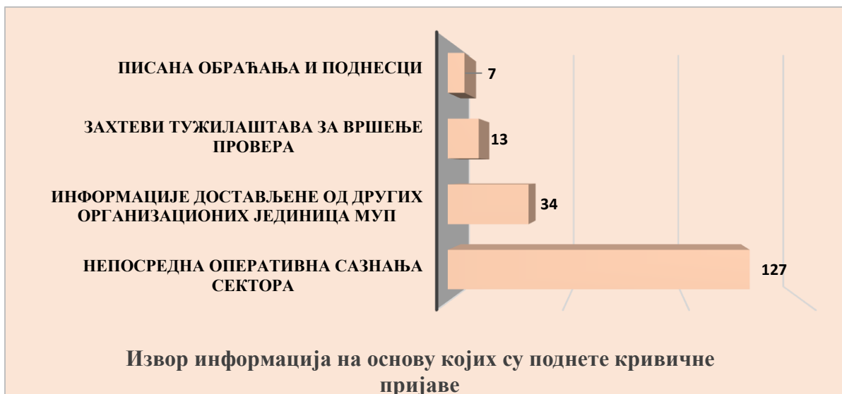
Графикон број 2