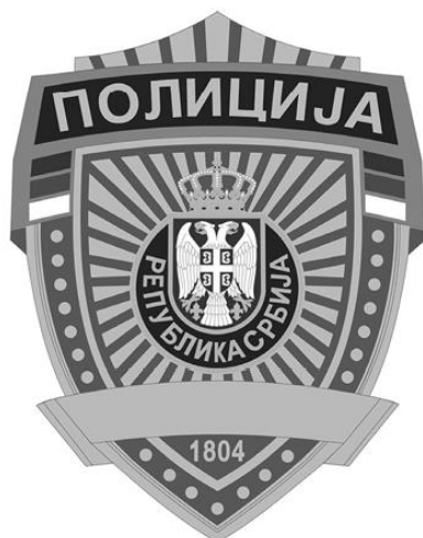
Значка ОСЛ у Дирекцији полиције