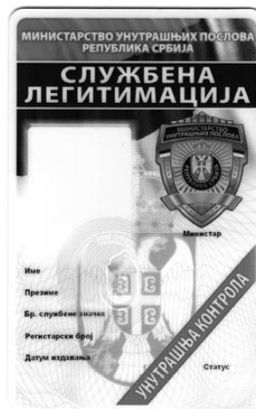
Образац службене легитимације за полицијског службеника Сектора унутрашње контроле