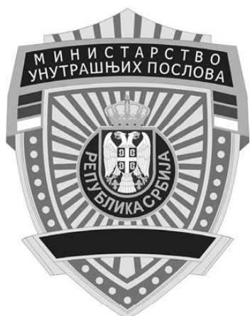
Значка министра унутрашњих послова