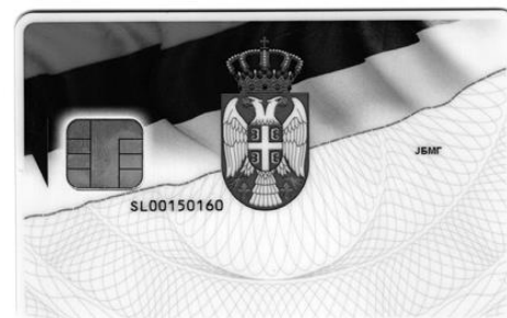
Образац службене легитимације (полеђина)