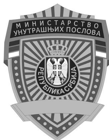
Значка ОСЛ у Кабинету министра, Секретаријату и секторима