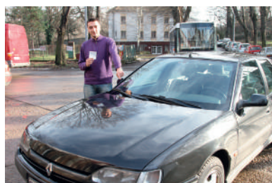
4 ПОЗИЦИОНИРАЊЕ НА ДОЊИ ДЕСНИ ДЕО ВЕТРОБРАНКОГ СТАКЛА