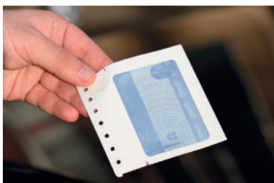
1 ИЗГЛЕД УРУЧЕНЕ НАЛЕПНИЦЕ