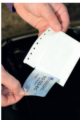
3 СКИДАЊЕ НАЛЕПНИЦЕ СА НОСАЧА НАЛЕПНИЦЕ