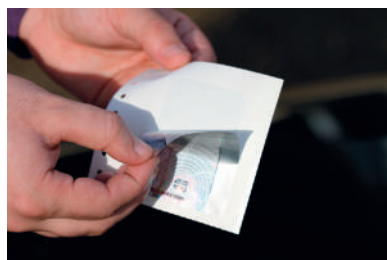
2 СКИДАЊЕ НАЛЕПНИЦЕ СА НОСАЧА НАЛЕПНИЦЕ