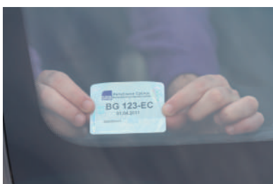
5 ПОЗИЦИОНИРАЊЕ НА ДОЊИ ДЕСНИ ДЕО ВЕТРОБРАНКОГ СТАКЛА